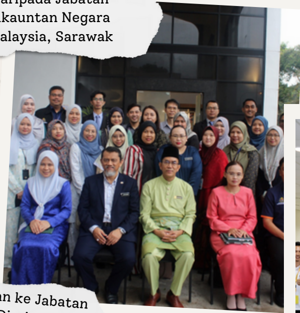
Lawatan Penanda Aras daripada Jabatan Akauntan Negara Malaysia, Sarawak